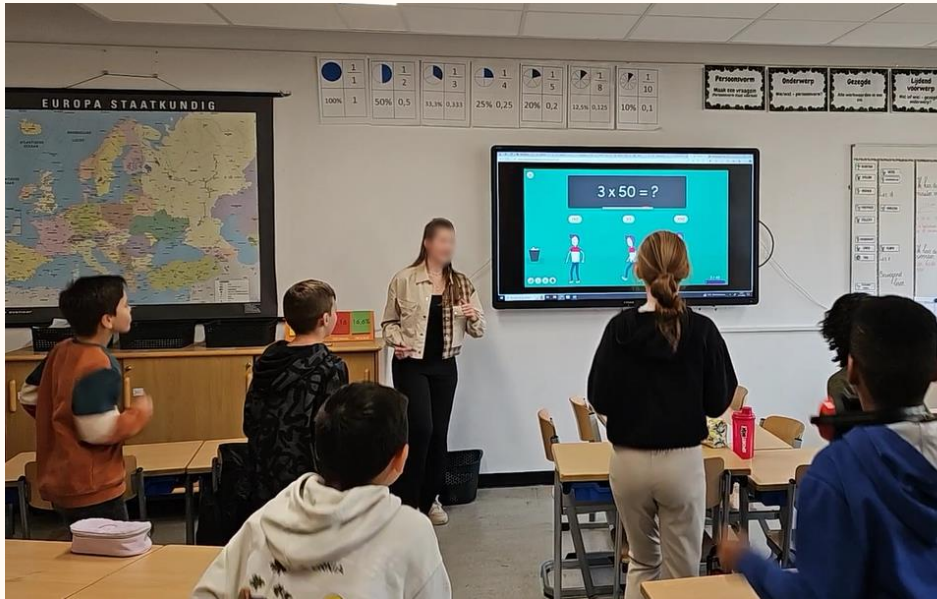
Figuur 4.1 Bewegend leren activiteit tijdens de rekenles